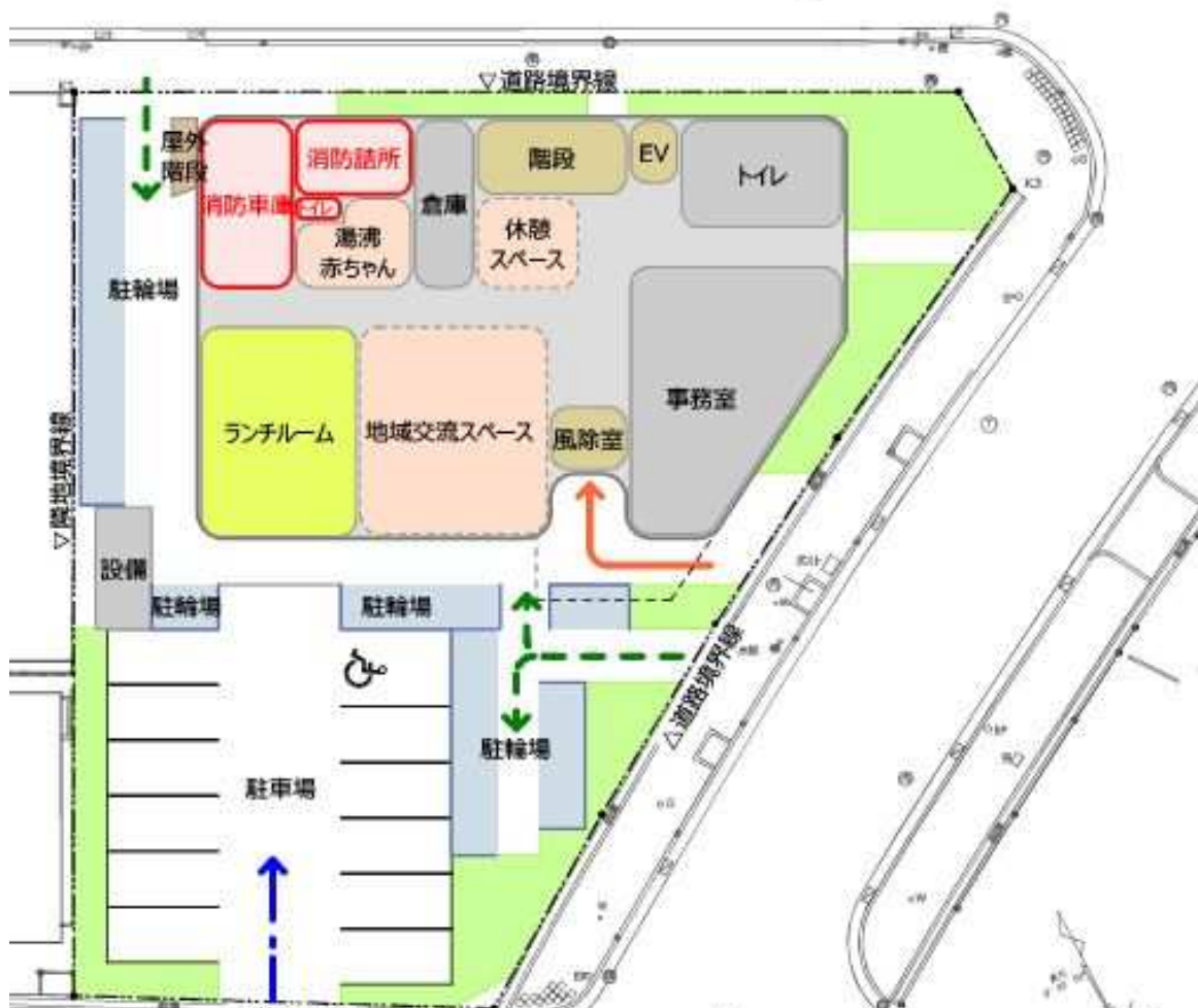
[1] 配置計画図 (案)