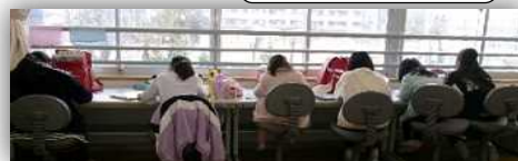
ルームで仲良くなった1年生～5年生

連絡先：地域学校協働課 (0798-35-3652) コーディネーター携帯 (090-8515-3856)