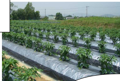
さん だ さん 三田産