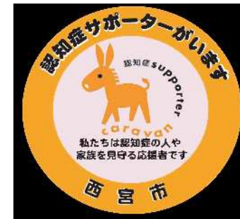
認知症サポーターステッカー

「認知症サポーター養成講座」を受講された企業（事業所・機関等）を対象に、認知症サポーターがいることを市民に知っていただくためのステッカーを交付しています。（複数の方が受講いただく等、一定の条件があります。）