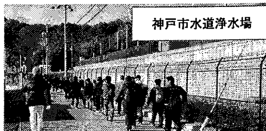
神戸市水道浄水場