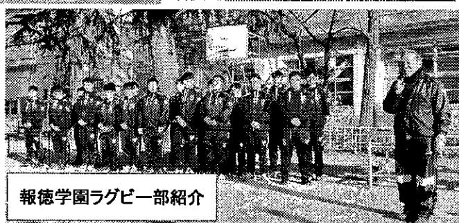
報徳学園ラグビー部紹介