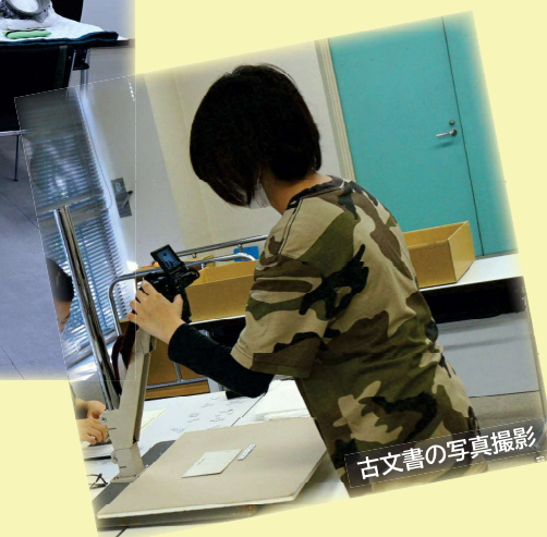
古文書の写真撮影