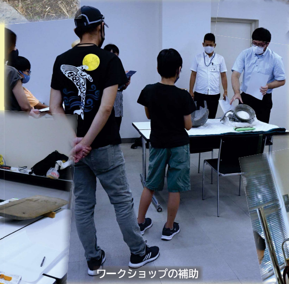
ワークショップの補助