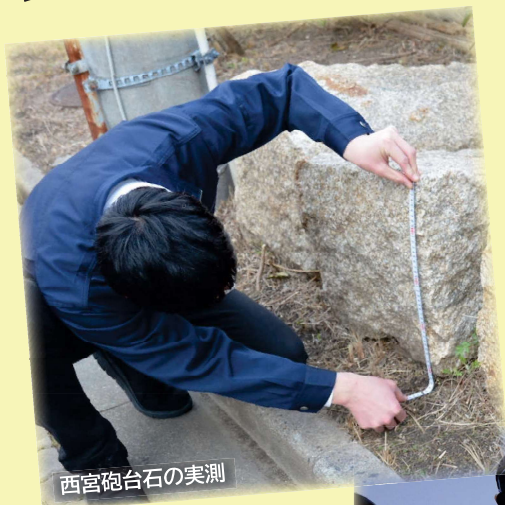
西宮砲台石の実測