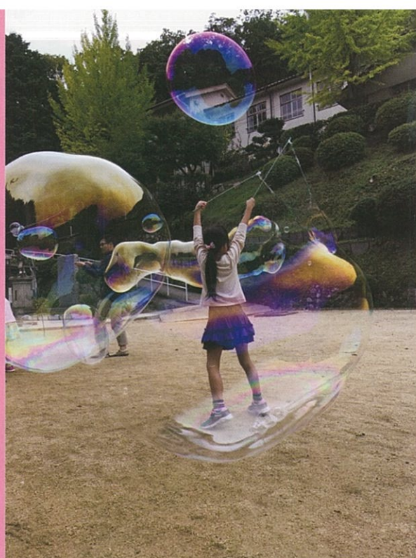
第8回山口フォトコンテスト 特選 豊 智子「バブルダンス」