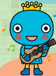
西宮市観光キャラクター みやたん © たかいしかず