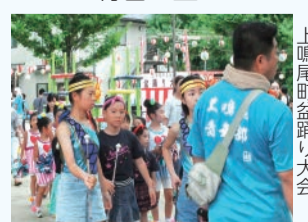
毎年「ぎわい」をみせる上鳴尾町盆踊り大会

「住んで良かった」「故郷が好きだ」と思ってもらえるような地域を皆さんと一緒につくりたいです。