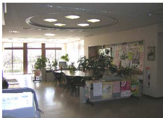
談話・読書コーナー