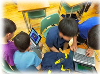
プログラミング しょうず 上手だね