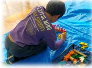
無心にドミノならべ中