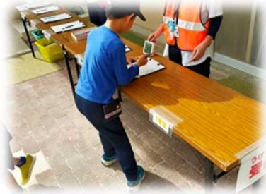
広場でもルームでも受付します