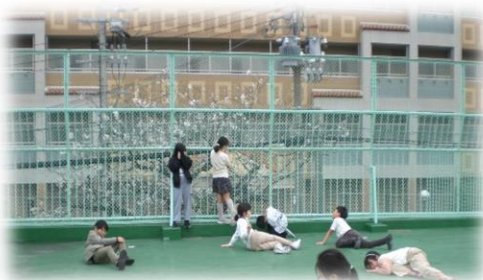
桜を見ながらテラスであそんだよ🌸